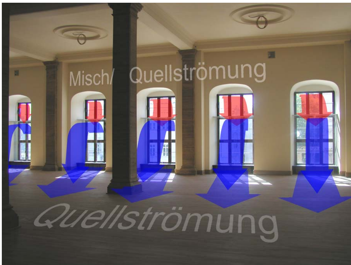
Bild 8: Strömungskonzept zweier überlagerter Strömungsformen; Quellströmung zur Frischluftverteilung + Misch/Quellströmung zum Heizen/Kühlen/Befeuchten und Entfeuchten