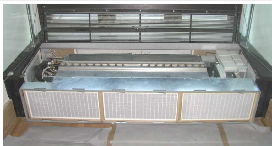
Bild 7: Einbau des dezentralen Klimagerätes QVM in eine Brüstungsnische / Koordination mit MSR / Sicherheitstechnik etc

Die Integration der Klimageräte in eine 300-Jahre alte Bausubstanz erfordert eine flexible Anpassung an die baulichen Gegebenheiten, die sich von einer Gebäudeachse zur nächsten stark ändern können, siehe Bild 7. Dies wird durch einen modularen Geräteaufbau und eine flexible Fertigung stark vereinfacht, so dass für unterschiedliche Brüstungsgeometrien eine geräteseitige Anpassung vorgenommen werden. Ebenso konnten Sondergeräte für den Bodeneinbau und Umluftgeräte für den Wandeinbau angepasst werden.