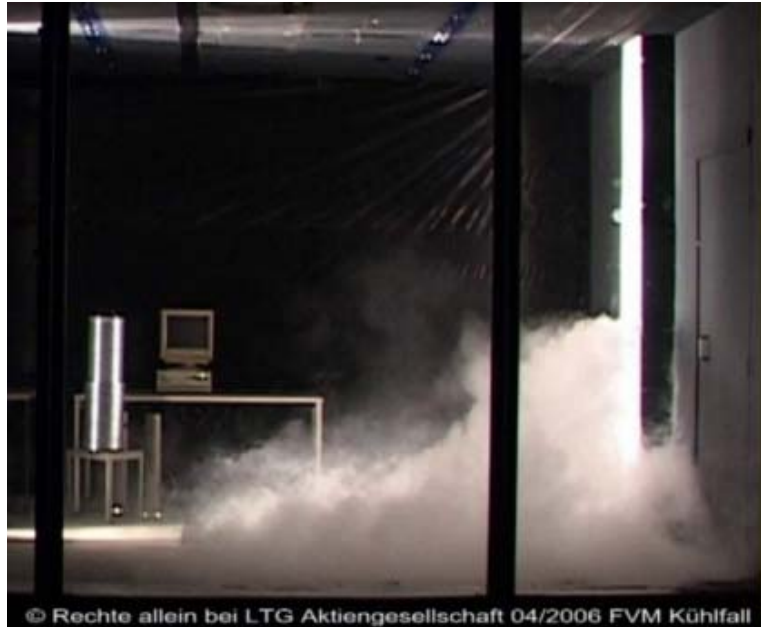
Bild 3: Sichtbarmachung der Raumströmung im Kühlfall (Laborversuch)

Durch die automatische oder manuelle Wahl der Außenluftströme im Verhältnis 1:3 bis 1:4 wird für alle Betriebsarten von „Abwesenheit“ bis „Besprechung“ eine gute Luftqualität erreicht.